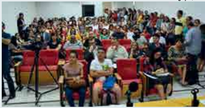
Fechamento do equipamento foi solicitado pelo Ministério Público Federal

Em sua fala, o vereador fez uma breve explanação sobre a luta antimanicomial e defendeu a rede de apoio ao tratamento psicossocial das pessoas com transtornos mentais. "Vamos promover o debate em cima dos relatórios apresentados e amadurecer os argumentos sobre o tema. Precisamos garantir a dignidade dessas pessoas e assegurar os direitos individuais.