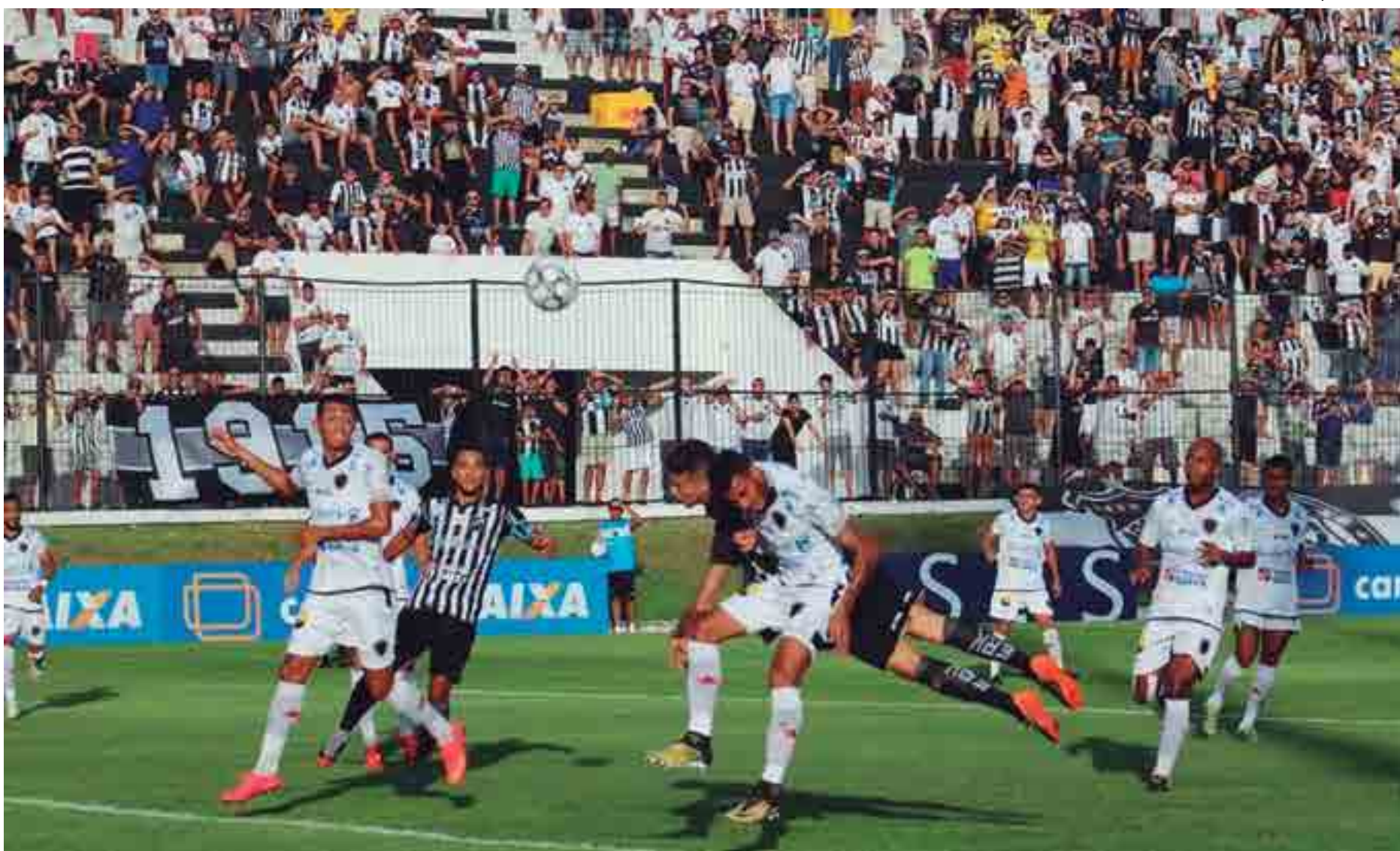
No último fim de semana, o Botafogo teve a sua primeira derrota na Série C deste ano nos 2 a 0 para o ABC, no Frasqueirão. Agora o time busca a reabilitação em casa diante do time paraense