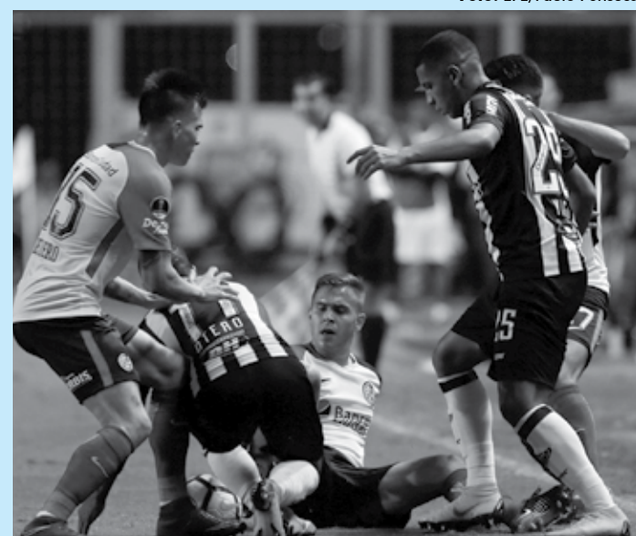
Atlético escalou um time misto e acabou sendo eliminado da Sul-Americana