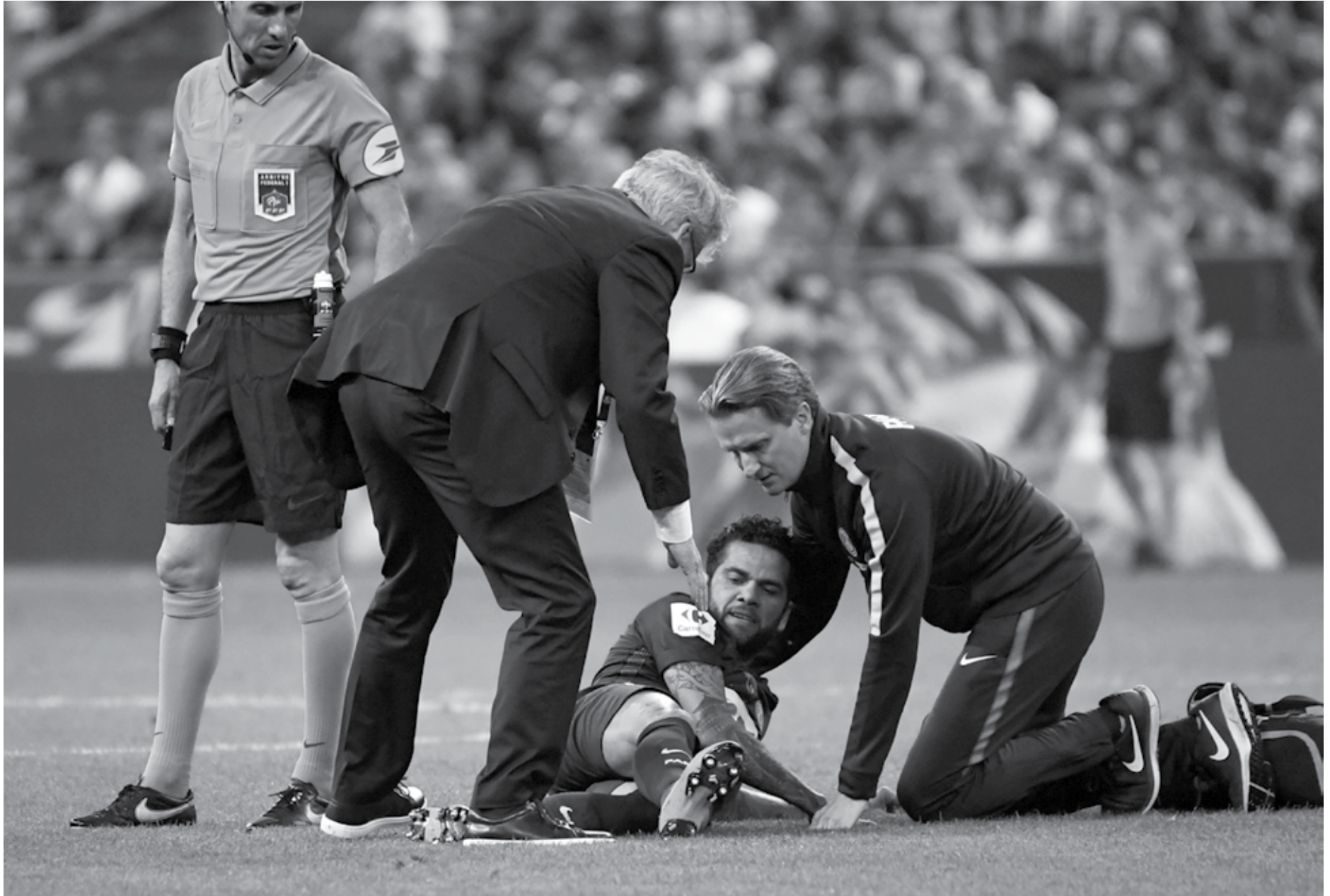
A séria lesão de Daniel Alves foi exatamente a poucos dias do técnico da Seleção Brasileira, Tite, fazer a última convocação do elenco que vai defender o país na Copa do Mundo da Rússia

O veterano tenta disputar sua terceira Copa do Mundo. Ele esteve na África do Sul (2010) e no Brasil (2014), chegando às quartas de final e, posteriormente, à semifinal.