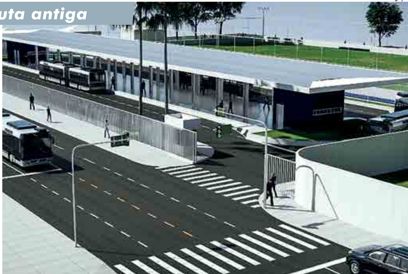
Moradores reivindicavam obra há mais de um ano, mas Prefeitura de João Pessoa alegava não ter dinheiro. Vereadores garantiram recursos