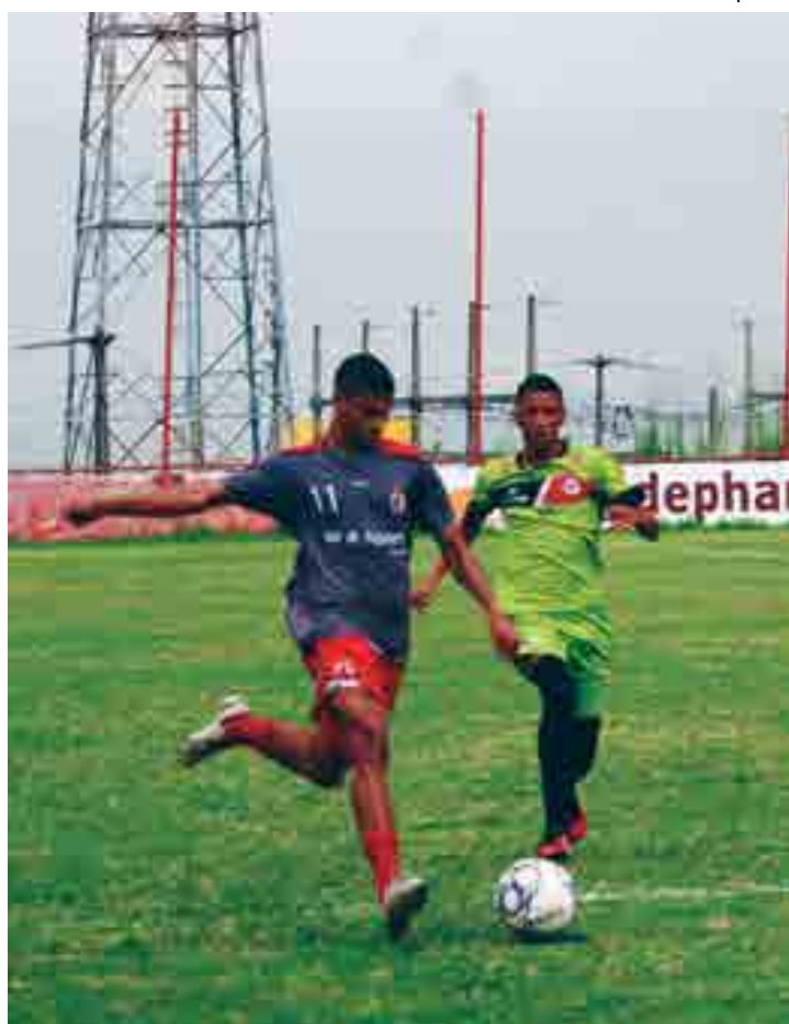
Jogadores do Campinense seguem treinando visando jogo com o Flamengo