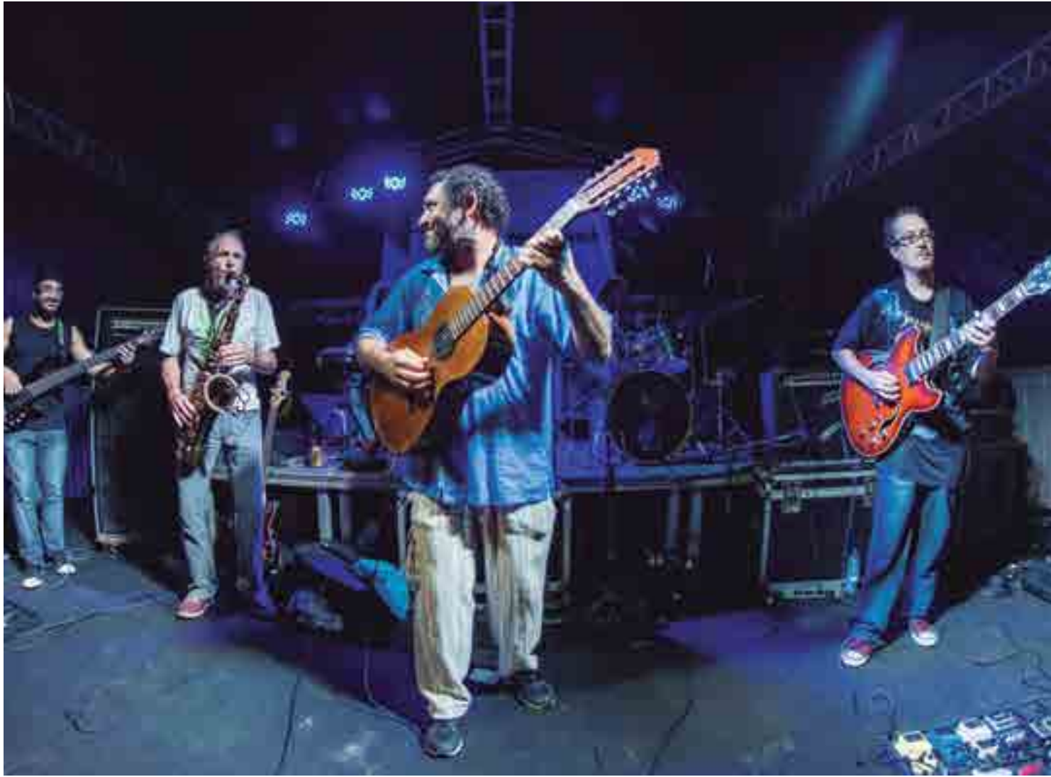
A banda Néctar do Groove é bastante conhecida na cena musical alternativa da Paraíba, com uma pegada forte de jazz com mistruza de outros ritmos