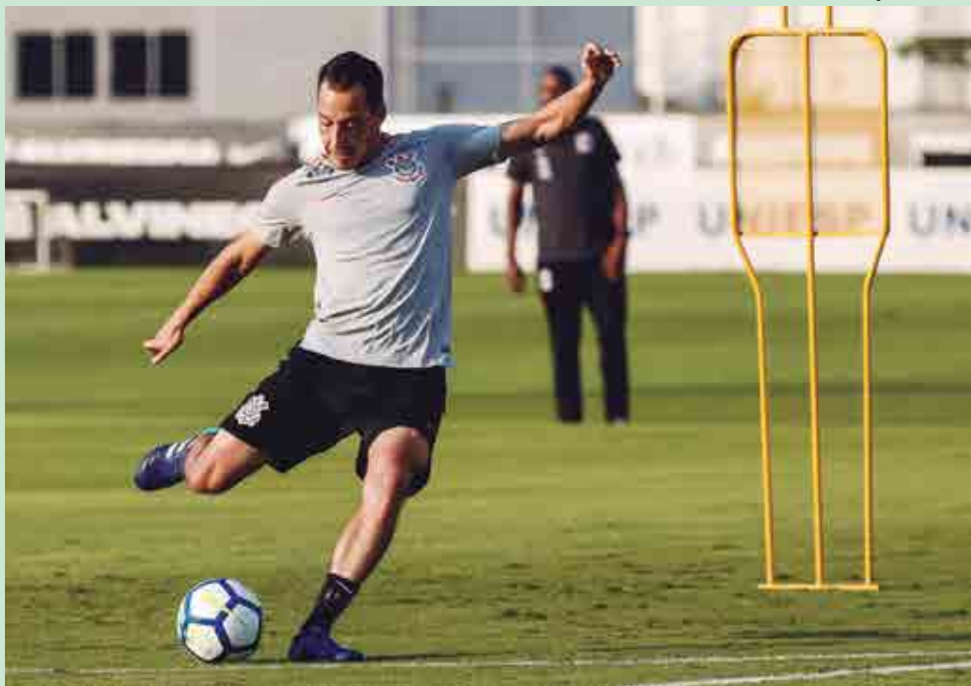
O meia treinou com boa desenvoltura e está escalado pelo técnico Fábio Carille para enfrentar o Vitória pelas oitavas de final da Copa do Brasil