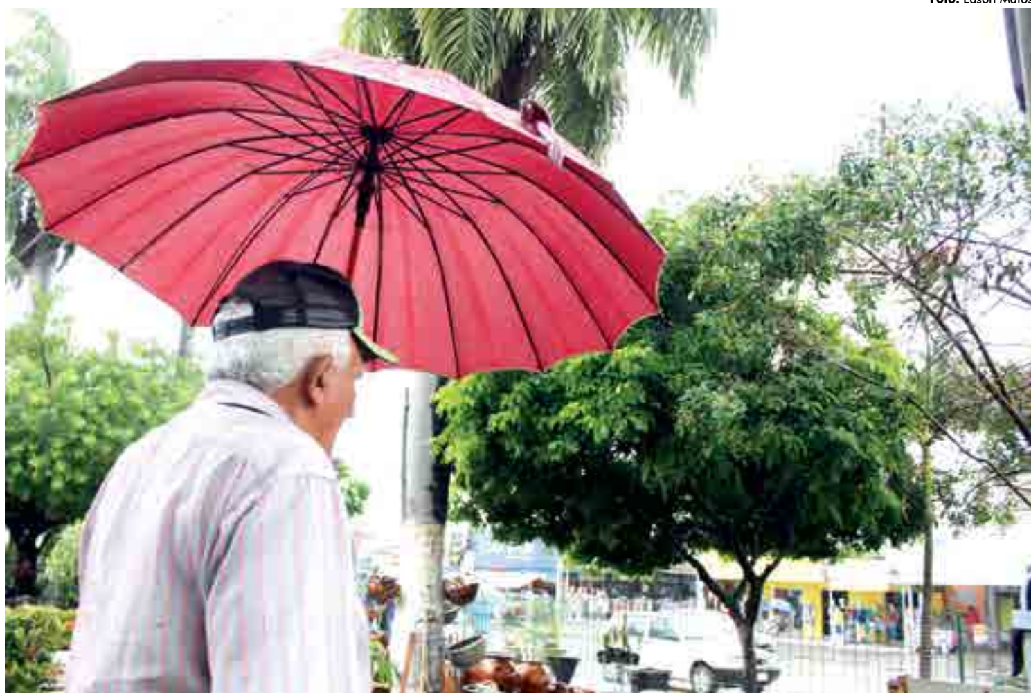
Para hoje, segundo dados do Inmet, existem condições meteorológicas favoráveis a ocorrência de acumulado significativo de chuva entre 30mm e 50mm