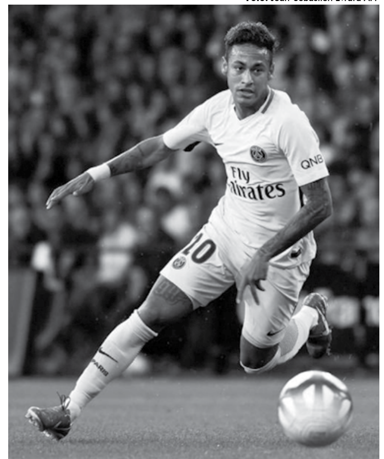
Neymar pode custar mais de 1 bilhão de reais ao Real Madrid